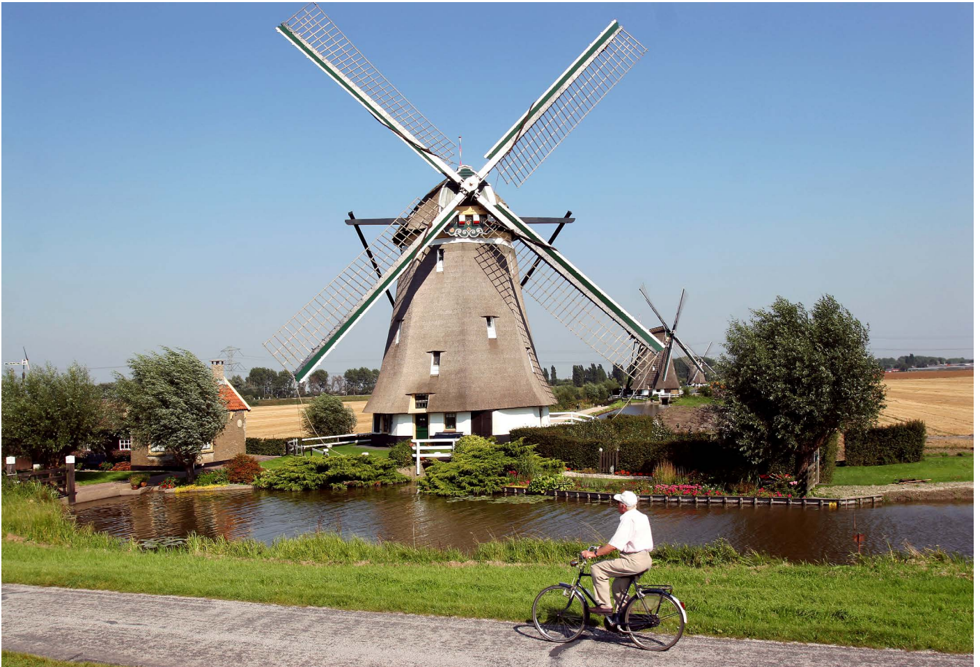
Molen Viergang, Zevenhuizen

De samenwerking met Ortec Finance wordt nog steeds als erg goed ervaren, gaat Iskander verder. “We zitten momenteel bijvoorbeeld in een conversietraject van onze heffingsapplicatie wat best intensief is. Gelukkig is de samenwerking met Ortec Finance nog steeds erg goed, en ondersteunen zij ons nog steeds. Wanneer er iets niet lekker loopt tussen de heffings- en waarderingsoftware – ook al ligt de fout niet bij Ortec Finance – kunnen we altijd bellen en wordt het direct opgelost. Zo laten ze nog steeds zien zich verantwoordelijk te voelen en hun beloftes na te komen, waardoor de WOZ-waardering voor ons niet langer een zorg meer is.”